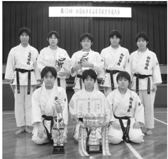
女子団体組手優勝 御殿場西高校