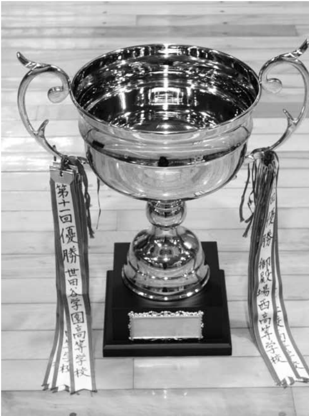
男子団体組手優勝