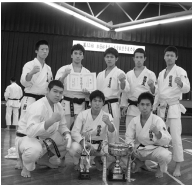
男子団体組手優勝 世田谷学園高校