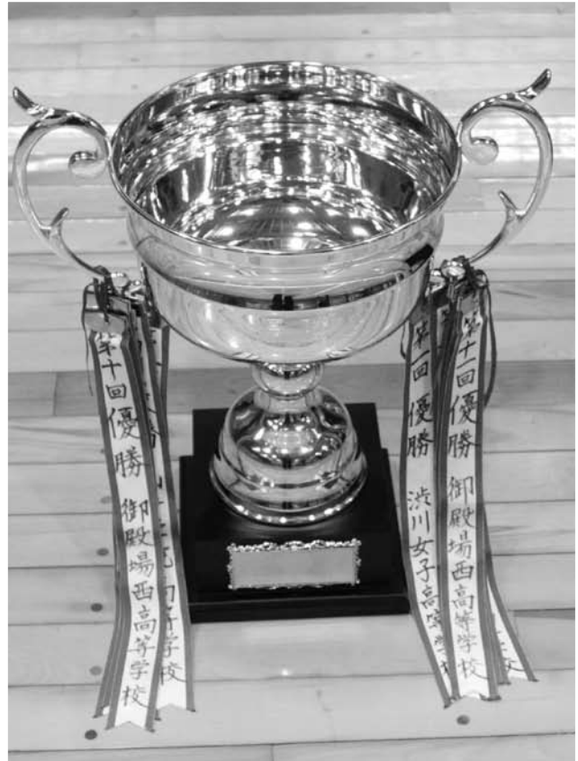
女子団体組手優勝